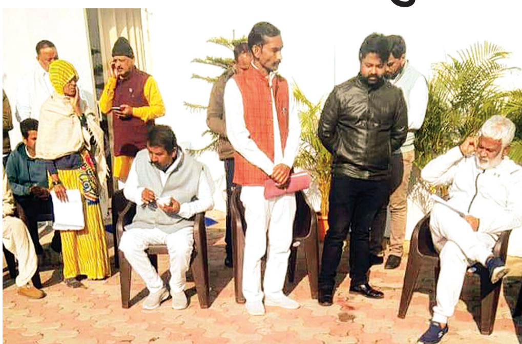
हरिभूमि न्यूज ►► ललितपुर

भौंरट बांध परियोजना से विस्थापित किसानों और ग्रामीणों ने परिसंपत्तियों का समुचित मुआवजा न मिलने से निराश होकर मुख्यमंत्री जनता दरबार में गुहार लगाई है। विस्थापितों ने न केवल लंबित