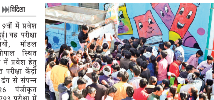
हरिभूमि न्यूज ►► विदिशा

कई केंद्रों पर अधिकारियों ने किया निरीक्षण