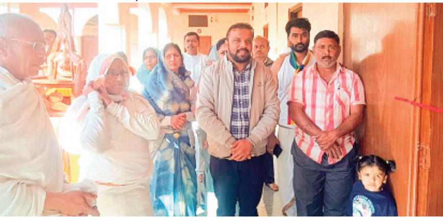
हरिभूमि न्यूज ►► बीना

ज्ञान भारतम एक राष्ट्रीय पहल है जिसका उद्देश्य भारत की पारंपरिक डिजिटल बनाना है। यह मिशन संस्कृति मंत्रालय भारत सरकार द्वारा शुरू किया गया है और इसका उद्देश्य प्राचीन पाण्डुलिपियों को डिजिटल रूप में परिवर्तित करना है, ताकि वे आने वाली पीढ़ियों के लिए सुलभ रहें। ज्ञान भारतम के तहत, विभिन्न विश्वविद्यालयों और संस्थानों में पाण्डुलिपियों का संरक्षण और डिजिटलीकरण किया जा रहा है।