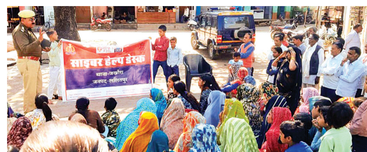
हरिभूमि न्यूज ►► ललितपुर

जिले में बढ़ते साइबर अपराधों पर अंकुश लगाने और लोगों को जागरूक करने के उद्देश्य से थाना जखौरा की साइबर क्राइम सेल द्वारा रविवार को विशेष साइबर क्राइम जागरूकता अभियान चलाया गया। यह अभियान पुलिस अधीक्षक मो.मुस्ताक के निर्देशन में संचालित किया गया, जिसमें थाना क्षेत्र के आमजन को साइबर अपराधों से बचाव के संबंध में विस्तृत जानकारी दी गई। अभियान के दौरान पुलिस टीम ने साइबर बुलिंग, साइबर स्टॉकिंग, फिशिंग, स्लेबरी (ऑनलाइन ठगी), आईडेंटिटी थैप्ट जैसे अपराधों के तरीकों और उनसे होने वाले नुकसान के बारे में लोगों को अवगत कराया। साथ ही, तेजी से बढ़ रहे डीप फेक, आर्टिफिशियल इंटेलिजेंस के दुरुपयोग और डिजिटल अरेस्ट जैसे नए साइबर फ्रॉड के तरीकों पर भी विस्तार से जानकारी दी गई। पुलिस टीम ने आमजन को सतर्क करते हुए बताया कि किसी भी अनजान लिंक पर क्लिक न करें और केवल प्ले स्टोर या